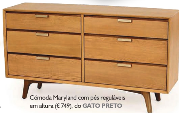
Cómoda Maryland com pés reguláveis em altura (€ 749), do GATO PRETO