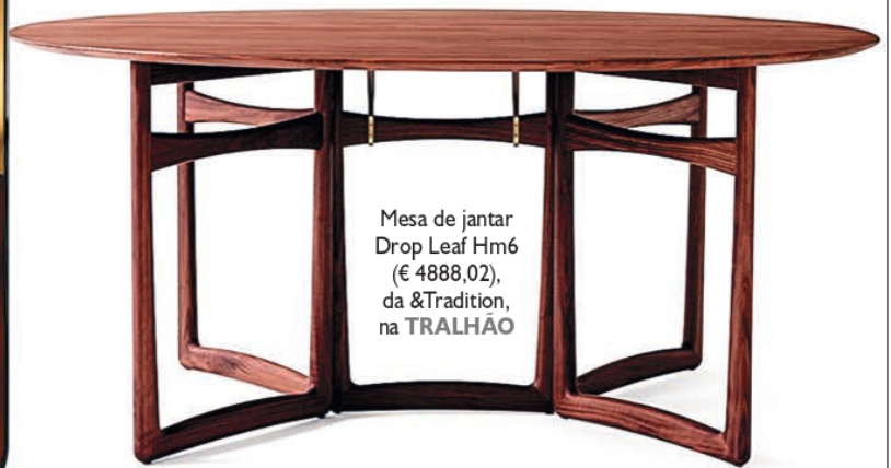
Mesa de jantar Drop Leaf Hm6 (€ 4888,02), da &Tradition, na TRALHÃO