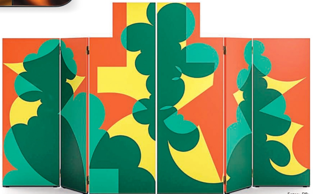
Biombo Balla em madeira colorida, da Cassina, na GALANTE*