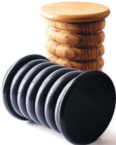
Bancos Macchiato em carvalho maciço ou mogno, da CAFFÉ LATTE*