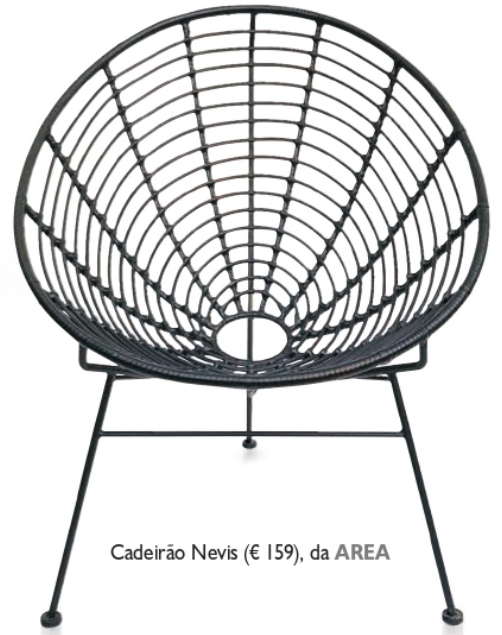
Cadeira Nevis (€ 159), da AREA