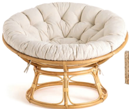
Cadeira em rotim com almofada em poliéster e enchimento com flocos de esponja (€ 199), da LA REDOUTE