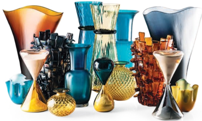
Peças decorativas em vidro Murano, da Venini, na QUARTO SALA*