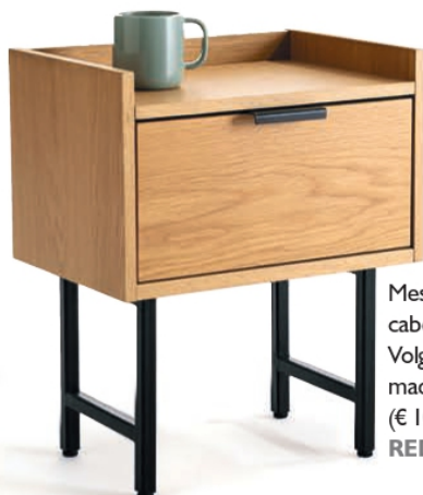
Mesa de cabeceira Volga em madeira e aço (€ 109), da LA REDOUTE