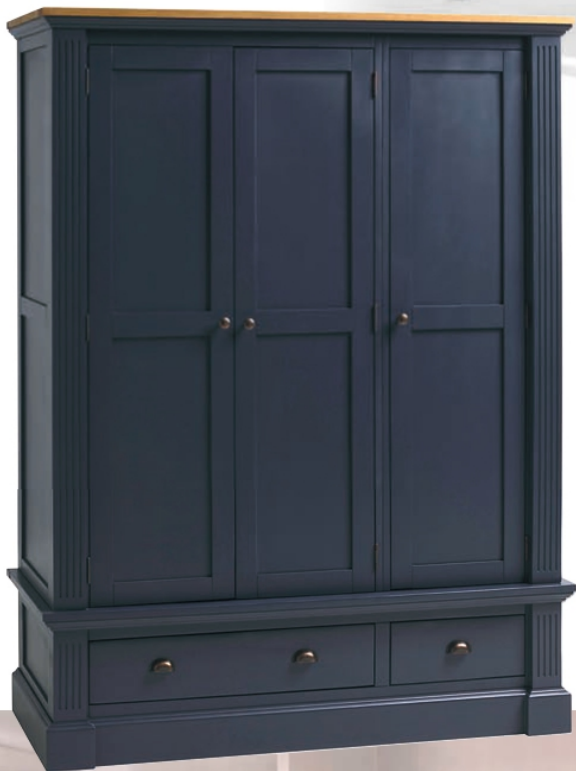
Guarda-roupa rústico em carvalho pintado, na OAK FURNITURELAND*