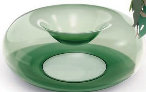
Taça Jelly da Cassina (€ 325,95), na CENA D'ARTE