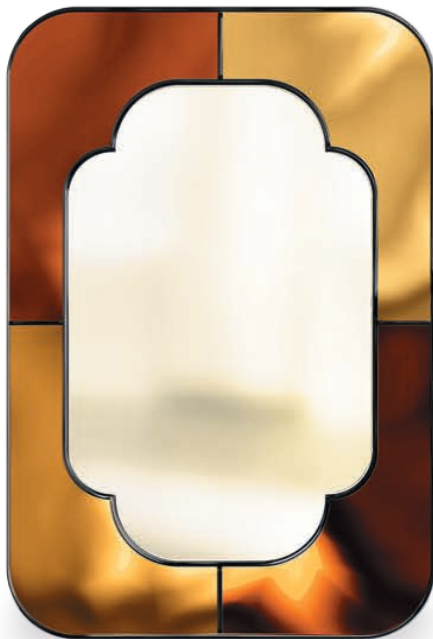
Espelho de parede Nilo (€ 2640), da HOMMÉS STUDIO*