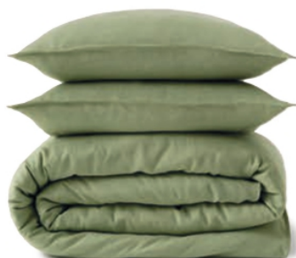
Capa de edredão em linho (a partir de € 99) e almofadas (€ 49,99), da MANGO