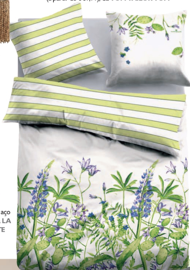
Edredão reversível puro algodão (a partir de € 59,99), da TOM TAILOR TOM