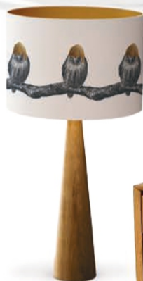
Abat jour em papel de belas artes e detalhe de ouro aplicado à mão (€ 87,69), da MOUNTAIN AND MOLEHILL