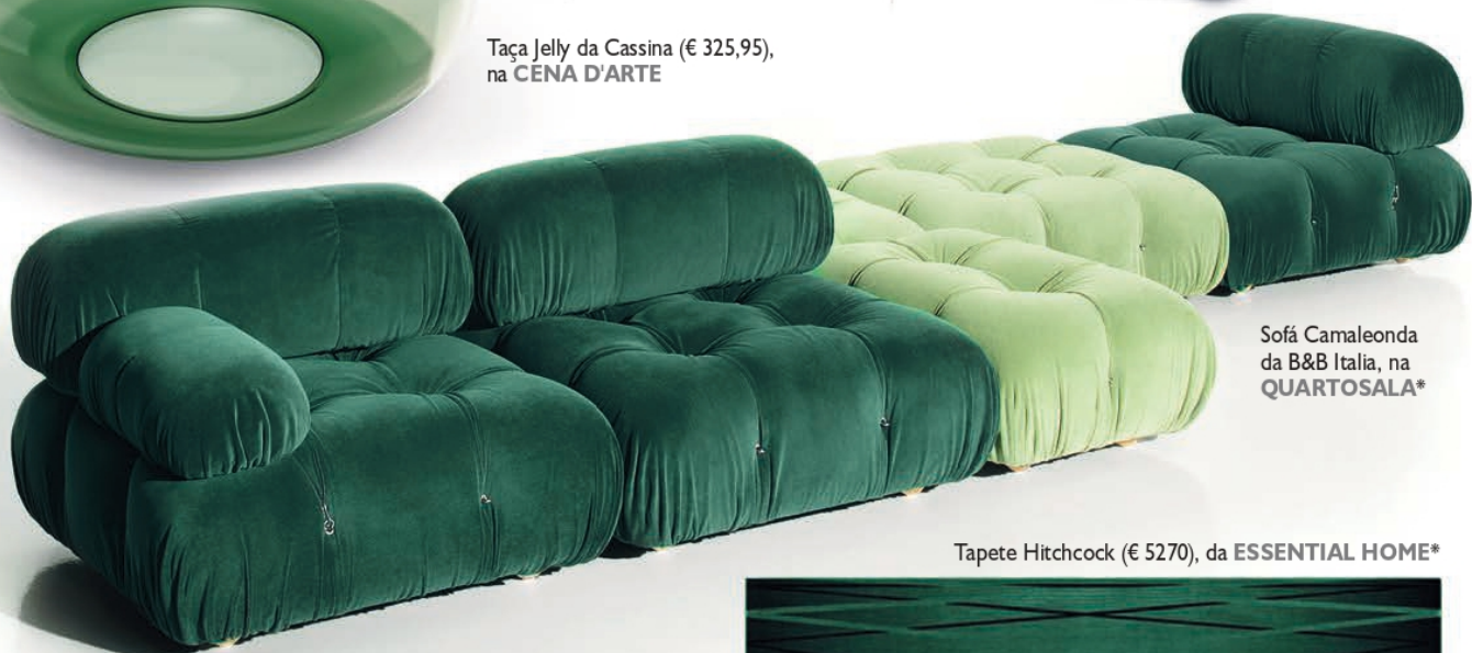
Sofá Camaleonda da B&B Italia, na QUARTOSALA*