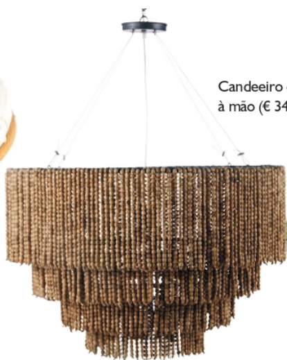
Candeeiro de teto com pérolas de abeto montadas à mão (€ 349,90), da MAISONS DU MONDE