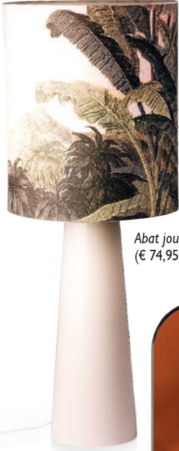
Abat jour em tecido estampado (€ 74,95), na CASANOVA STORE