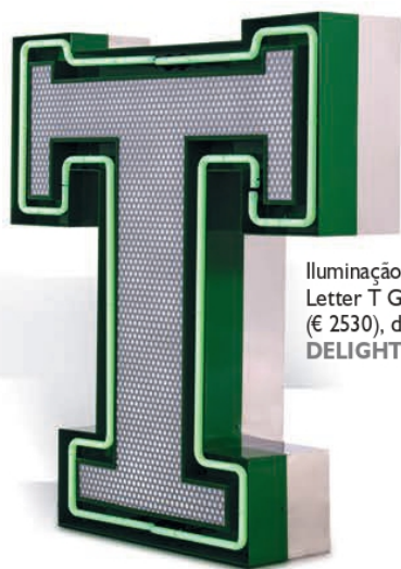
Iluminação Letter T Graphic (€ 2530), da DELIGHTFULL